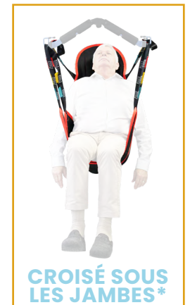
CROISÉ SOUS LES JAMBES*