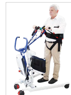
Aide à la déambulation