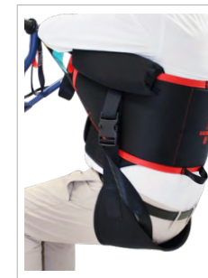
Sangle sous-fessière confort (SFC, en option)