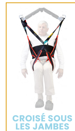
CROISÉ SOUS LES JAMBES