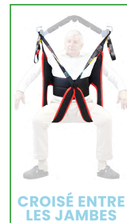
CROISÉ ENTRE LES JAMBES