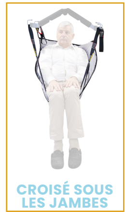
CROISÉ SOUS LES JAMBES