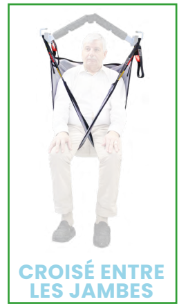
CROISÉ ENTRE LES JAMBES