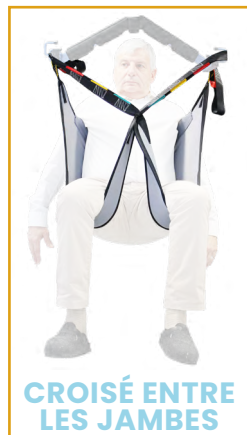
CROISÉ ENTRE LES JAMBES