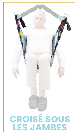
CROISÉ SOUS LES JAMBES