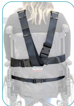
Modèle CECO + Module de Buste + Module pelvien