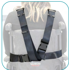
Modèle CECO + Module de Buste

a - Pour la mise en place de la ceinture ECO Intégrale, procéder d'abord comme pour la ceinture ECO Pelvienne (2) puis comme le paragraphe d et e de la ceinture ECO de Buste (3).