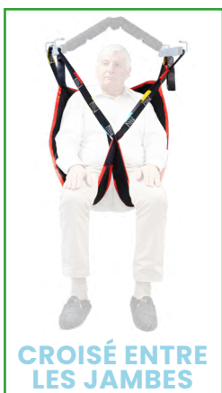
CROISÉ ENTRE LES JAMBES