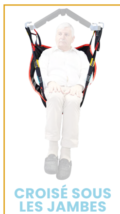
CROISÉ SOUS LES JAMBES