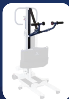
VÉRIN & BRAS DE LEVAGE + SANGLE DE TRACTION