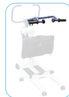
Bras de levage