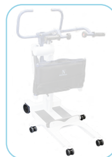
Roulettes (sur plateforme fixe uniquement)

NAUSICAA Médical vous offre la possibilité d'améliorer vos WAYUP 4 en WAYUP 5 grâce aux kits disponibles sur demande auprès de notre équipe commerciale (page 6).