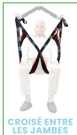
CROISÉ ENTRE LES JAMBES